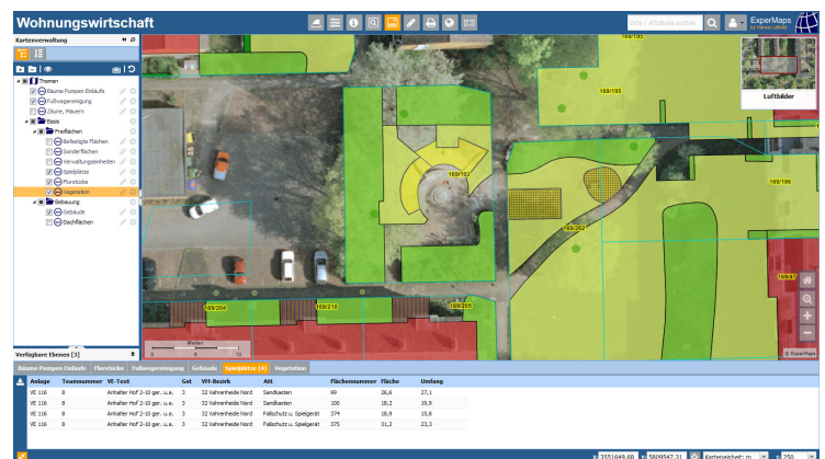
Sachinformationen aller dargestellten Datenebenen im Kartenausschnitt