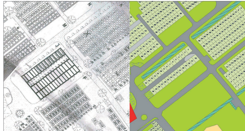
Analoger und digitaler Plan im Vergleich